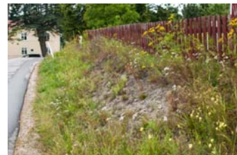
2019 Förra året fanns här i stort sett bara lupiner